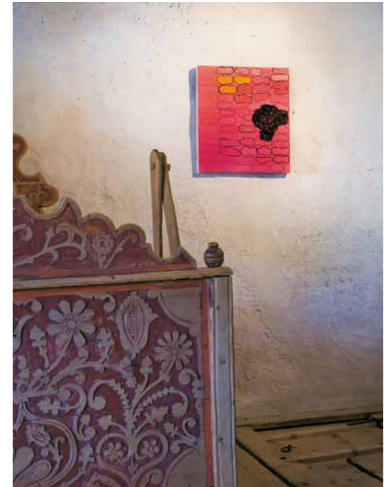
Jürgen Partenheimer, Carme , 2006, Öl auf Leinwand

-prozessen, sei es in Natur oder Zivilisation, und deren Sichtbarmachung durch künstlerisch-ästhetische Mittel im analogen Sinne.